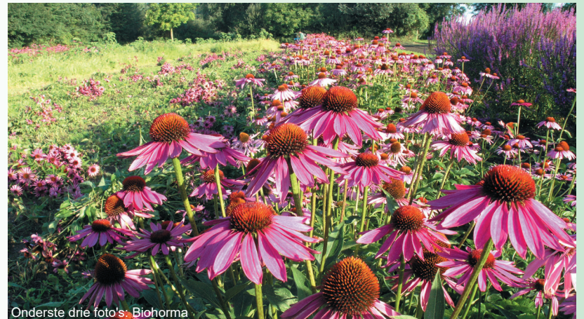
Onderste drie foto's: Biohorma